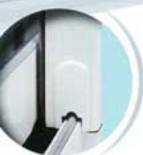
Rail disponible en aluminium ou en inox.