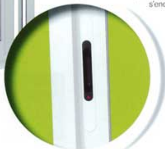
Poignée coquille design.

Avec le galandage, les « ouvrants cachés » permettent une discrétion totale en s'encastrant dans la cloison.